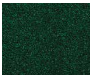
TH III Pro